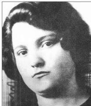
■ Раиса Истомина